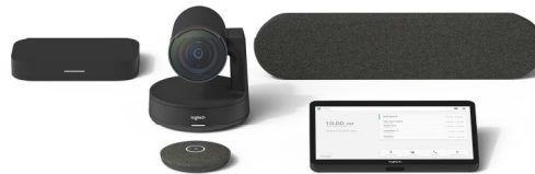
SALE DI MEDIE DIMENSIONI