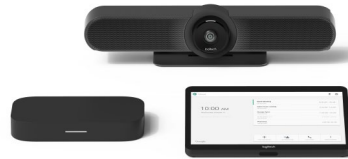
SALE DI PICCOLE DIMENSIONI