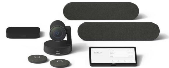
SALE DI GRANDI DIMENSIONI

FAI CLIC PER SCORPRIRE LE SOLUZIONI DI COLLABORAZIONE VIDEO LOGITECH PER GOOGLE MEET